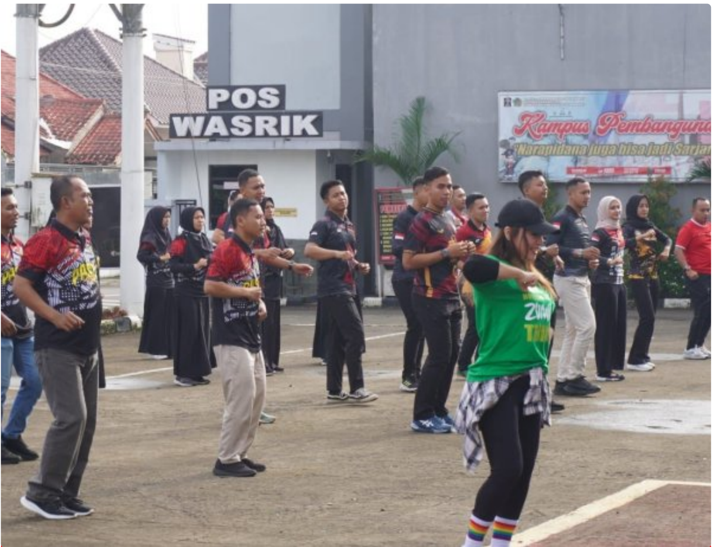
Jaga Kebugaran Tubuh, Pegawai Lapas Kelas IIA Purwokerto Senam Pagi Bersama

PURWOKERTO - Kegiatan senam pagi ini dilaksanakan di halaman gedung utama yang dimulai pukul 07.45 yang dipandu oleh instruktur profesional.